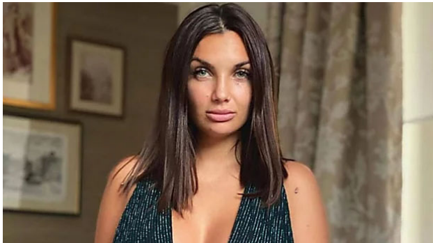
[fotografie] L'auto che Elettra Lamborghini guida a 27 anni toglie il fiato