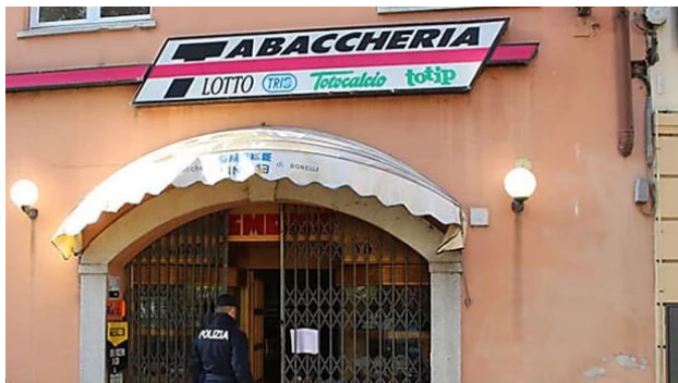
FURTO DA 10MILA EURO ALLA TABACCHERIA "SMOKE23"