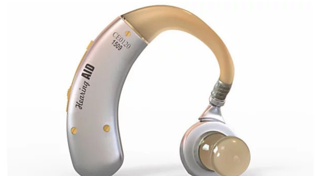
I prezzi degli apparecchi acustici nel 2022 ti sorprenderanno